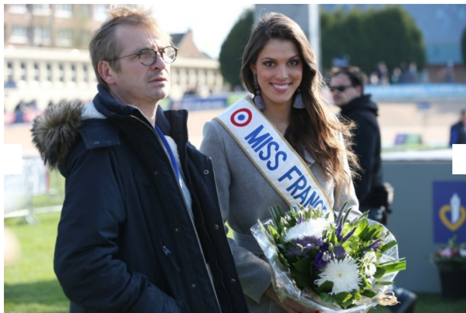
PHOTO Paris Roubaix 2016 - 10/04/2016 - Compiègne / Roubaix (257,5 km) - Iris Mittenaere, Miss France 2016